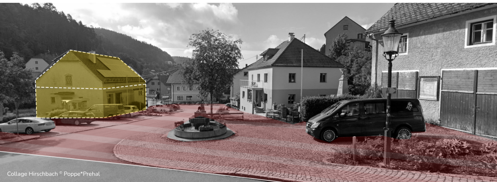
Collage Hirschbach